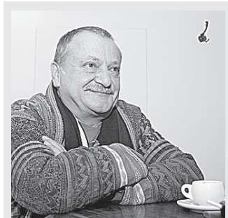
Pécsi Nyári Színház: Boeing, Boeing (Leszállás Párizsban). Rendező: Böhm György

ZSOLNAY KULTURÁLIS NEGYED (Planetárium): Állatok az égbolton. Az ember mindig csodálattal nézte, félté és tanulmányozta az állatvilágot: a szárazföldök félelmetes ragadozóit, a vizek szörnyeit és a levegő urait. Megismerve őket, nem maradhattak ki a csillagképek közül az égbolt beépítésékor sem. Az antik kultúrák élő környezetük függvényében helyezték a legfontosabbnak tartott állatokat az égre. A legfontosabb tájékoztató, időmérési főkör az ekliptika mentén is főként állatfigurák jelennek meg, kialakítva az állatövi jegyeket, más néven zodiákust. 45 perces előadásunk az állatvilág és a csillagképek kapcsolatát tárja fel az érdeklődők számára, a 8-14 éves korosztálynak (11.00).